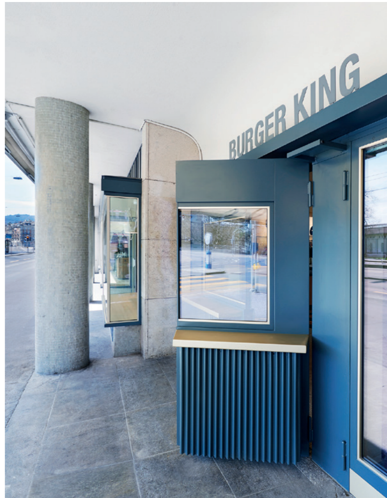
Abbildungen: 3 versteckte Türe