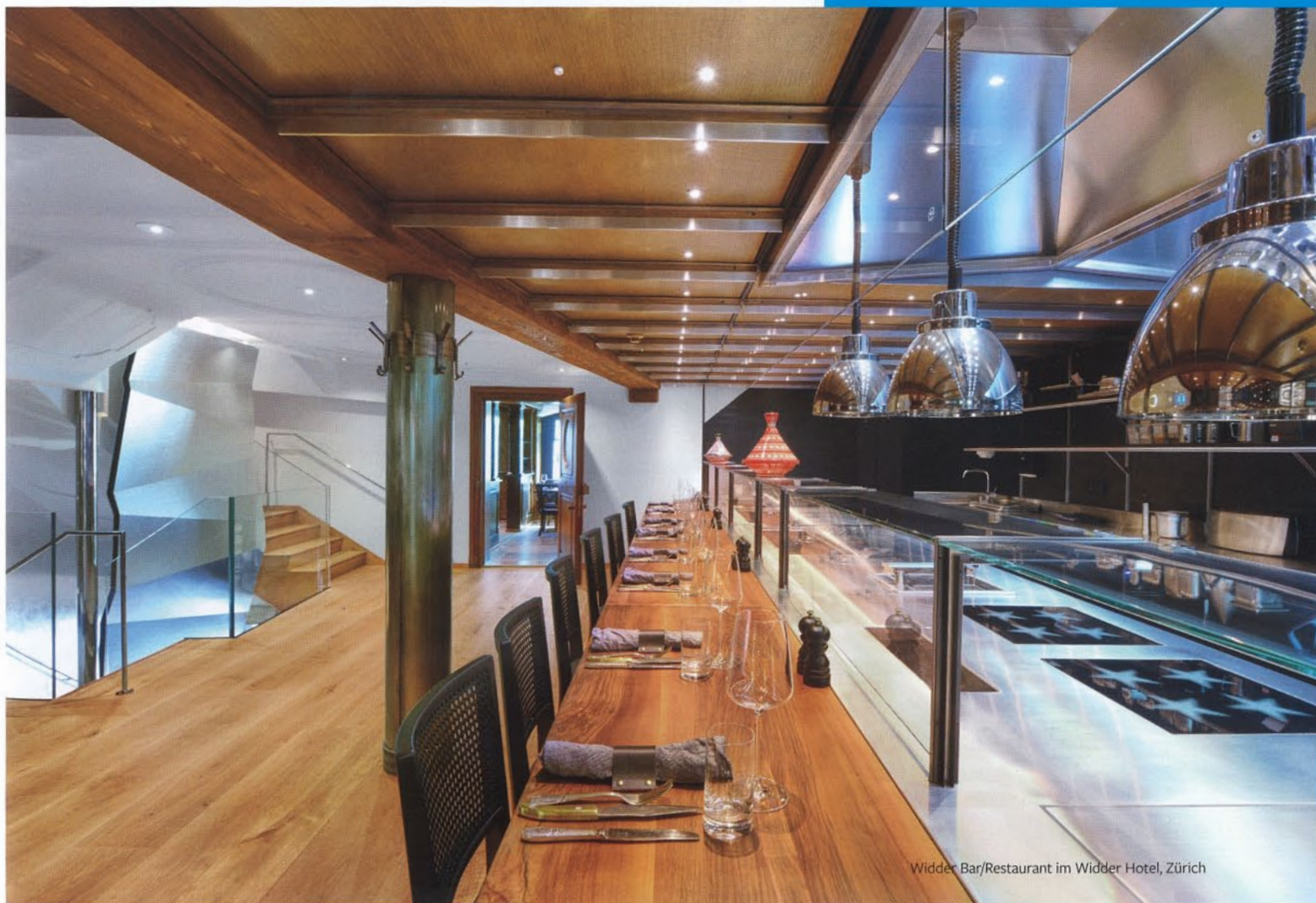
Widder Bar/Restaurant im Widder Hotel, Zürich

Interview: Sven Horsmann | Fotos: epireoteoht3t