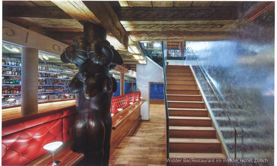
Widder Bar/Restaurant im Widder Hotel, Zürich